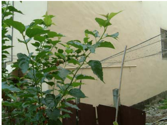
台灣中部桑椹枝葉右旋向上