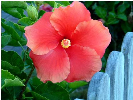
1.南半球左旋花瓣（紐西蘭國奧克蘭市）

還有佛教徒繞塔、禪坐後經行、咒輪的旋轉都是以順時針方向右繞而行，是否有意在鬆懈身體中受地球自西向東轉旋緊的“中脈”，值得深思探討。當然居住南半球的佛教徒，在平時的順時鐘情形下，是否修行時要逆時針左繞，也應一併考量。