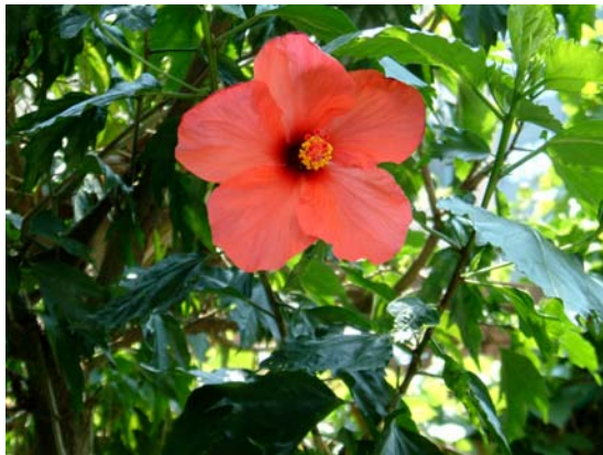
5.北半球的右旋花瓣（台北市仁愛路）

下面三張圖是 1994 年 5 月至 1995 年 2 月間，在美國華盛頓特區國家博物館集中展出抵抗納粹侵略的海報。