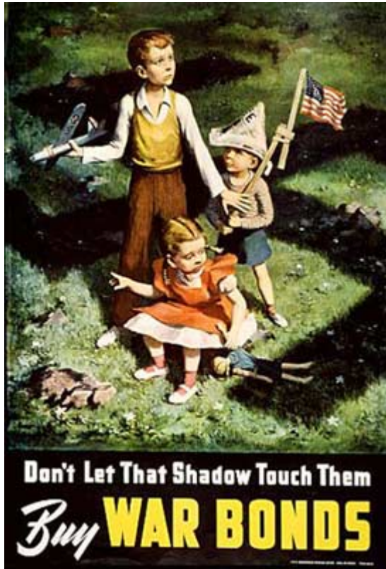
c.不要讓納粹的陰影接觸我們的孩子