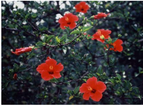
4.北半球右旋花瓣（台北市陽明山）