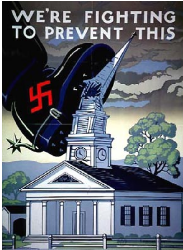
a. 我們戰鬥就是要防止這種侵略