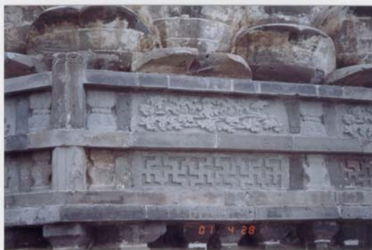
6. 遼代所建的招仙塔萬德兩種符號並連