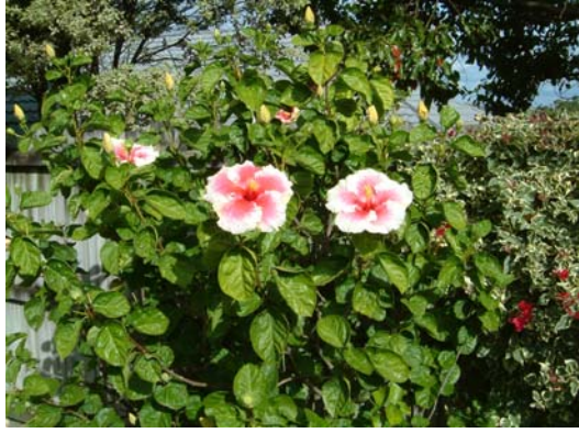
3.南半球左旋花瓣（紐西蘭國奧克蘭市）