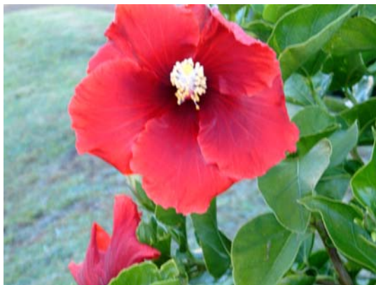
2.北半球右旋花瓣（台北市陽明山）