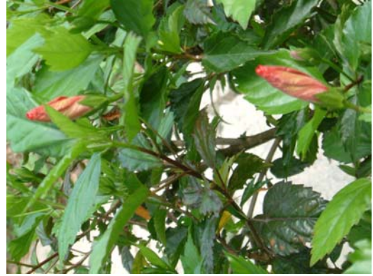
台湾中部都会公园里的花，含苞及谢花同株左右旋情形均有。