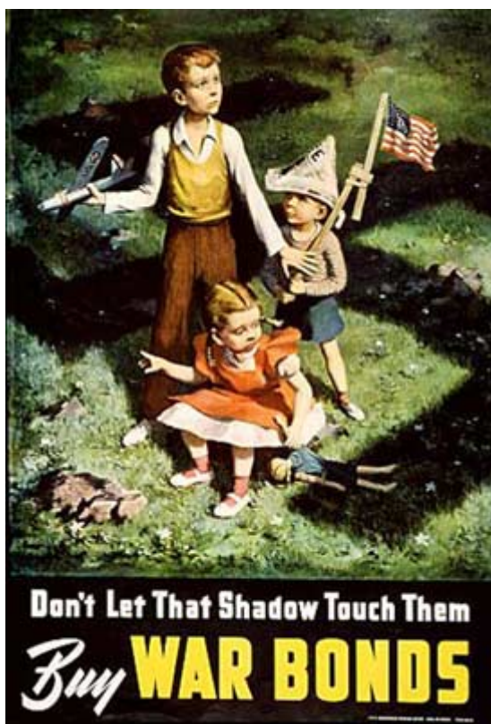
c. 不要让纳粹的阴影接触我们的孩子