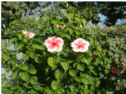
3.南半球左旋花瓣（纽西兰国奥克兰市）