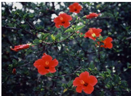
4.北半球右旋花瓣（台北市阳明山）