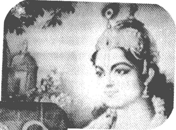
▲照片 4 公元前約 3100 年的印度 教女聖人克里殊納 (Kri- shna )，專以笛聲喚醒 無明中之人們。