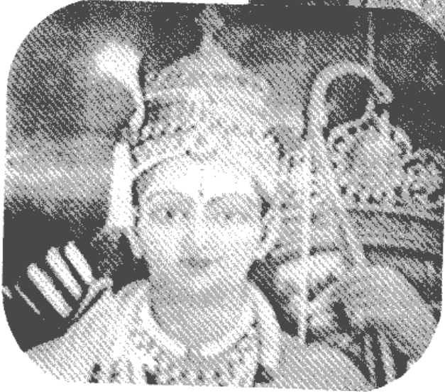
▼照片 3 印度教的喇嘛像